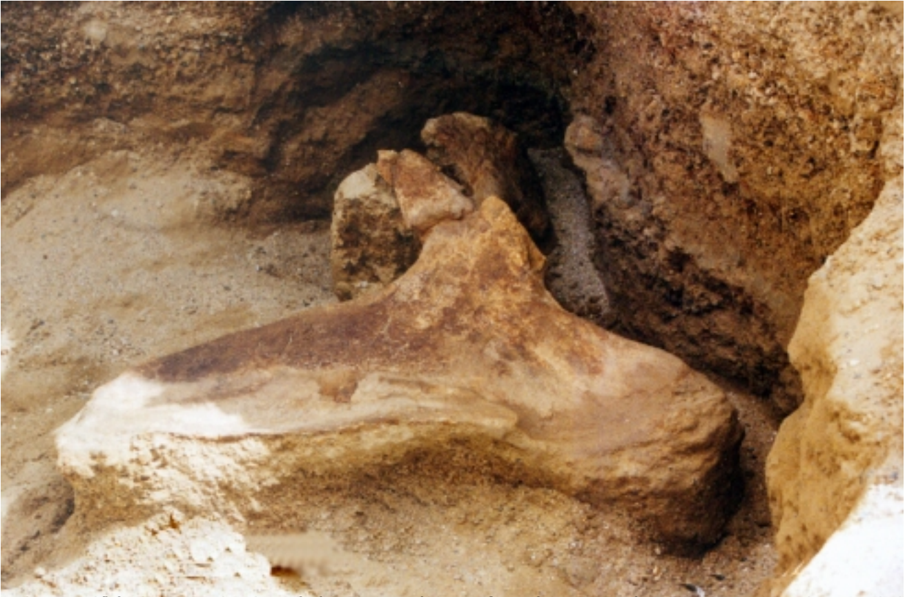
Σει. 2002 πύλη 2 στο ανώτερο τμήμα της σπηλιάς. Βασικό εύρημα: οστά του είδους Canis lupus .